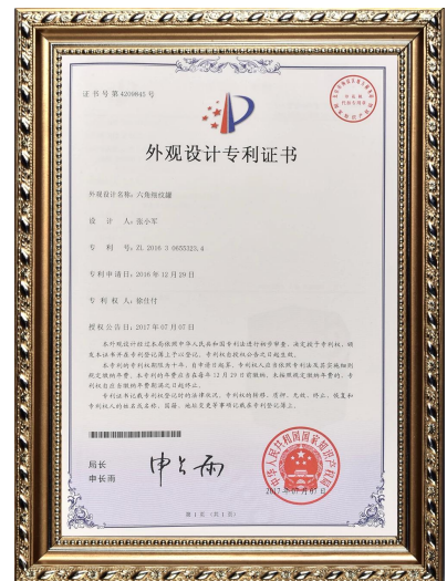
Патент №: 201630655323.4