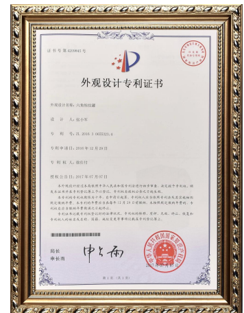
Номер патента: 201630655323.4.