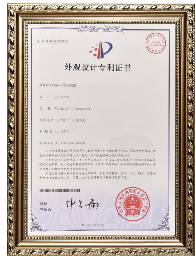
Номер патента: 201630655323.4.