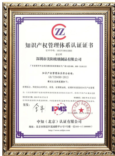
Интеллектуальная собственность предприятия