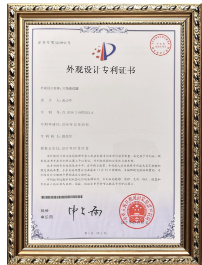
Номер патента: 201630655323.4.