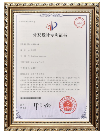
Патент №: 201630655323.4