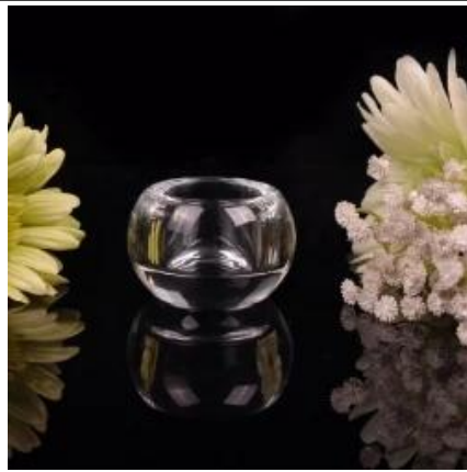
Круглый маленький держатель Tealight