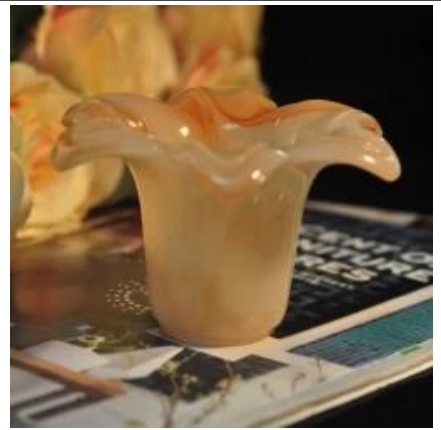
Цветок форма цилиндр нефрита янтарного цвета декоративного стекла держатель для свечи банку свечи