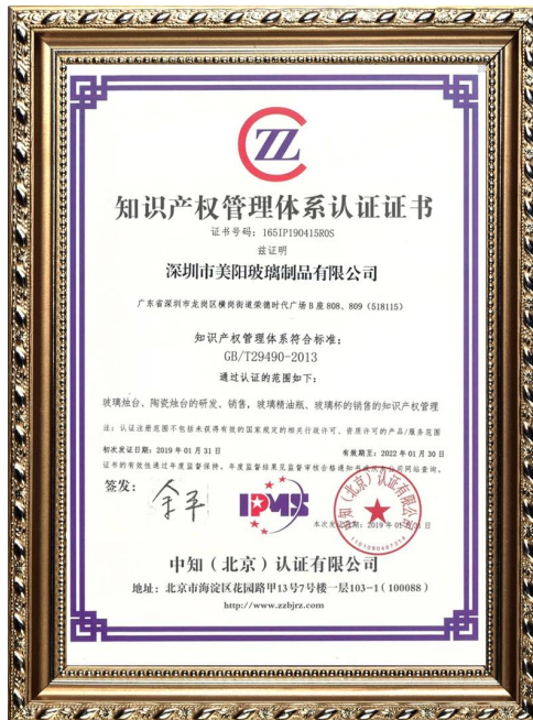
Интеллектуальная собственность предприятия