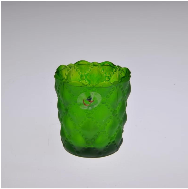
pulverizar o suporte de vela