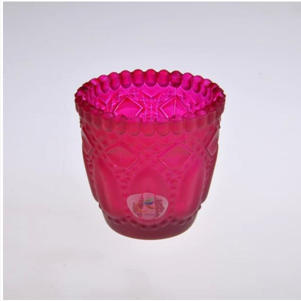
suporte de vela vermelha