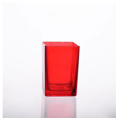
suporte de vela de vidro de cor de pulverizador