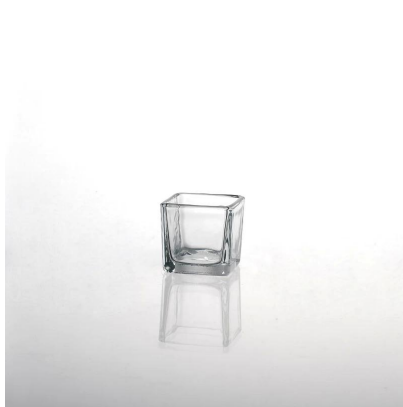
quadrado, limpar suporte de vela de vidro