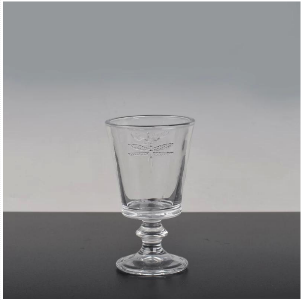
vela de vidro titular resultou