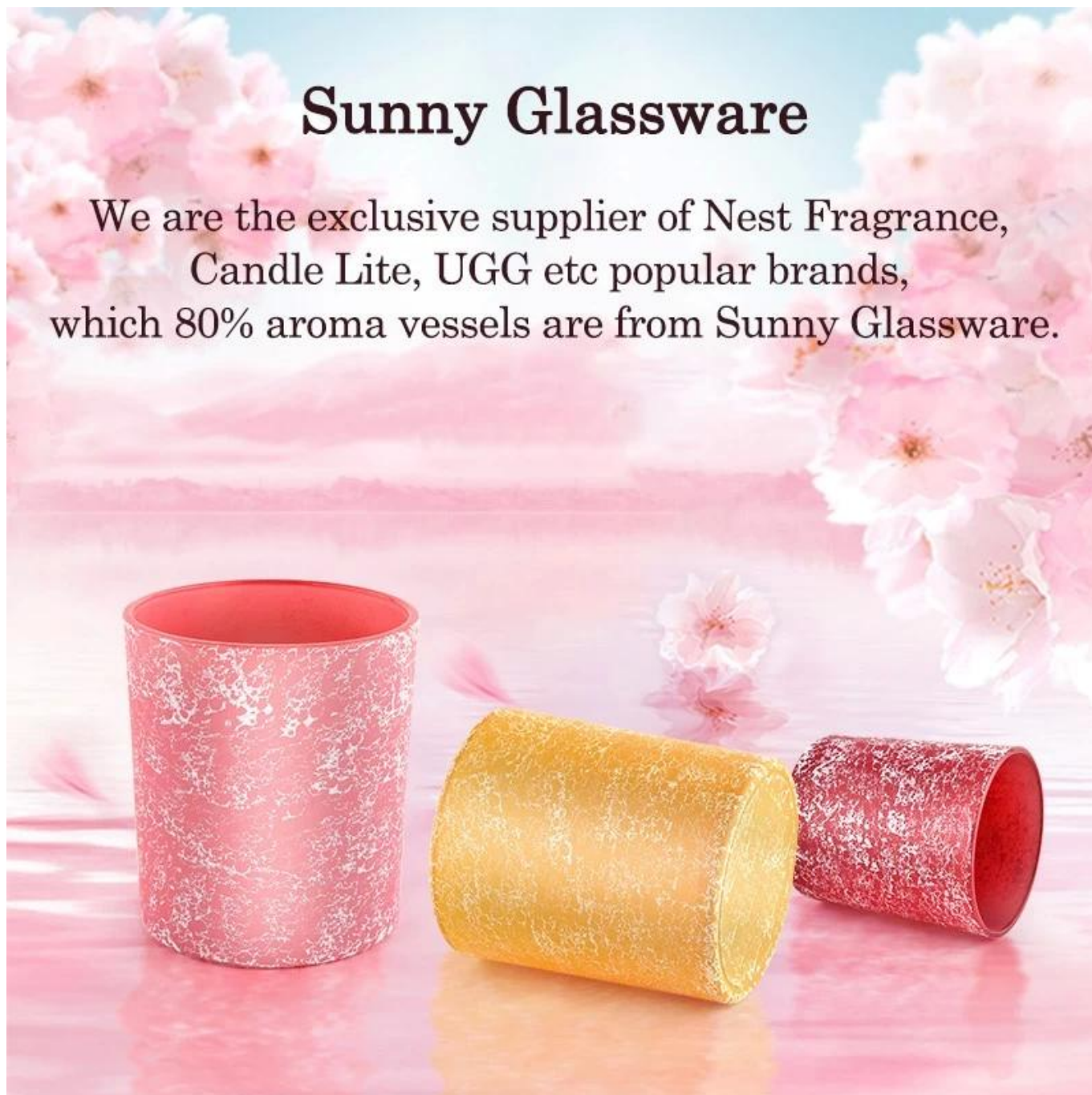
Imagem exclusiva de recipiente de vidro transparente jarro de vela para decoração