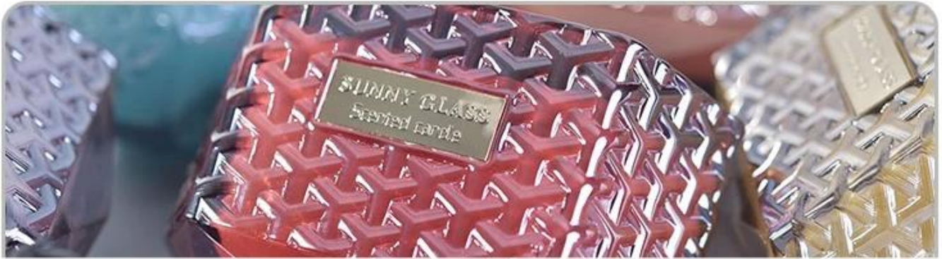
Glass Candle Holders