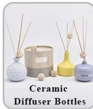
Ceramic Diffuser Bottles