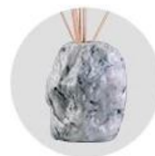
Water Transfer Printing