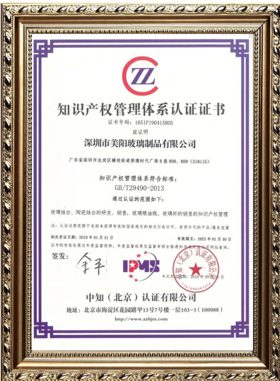
Propriedade intelectual corporativa Patente nº: 201630655323.4