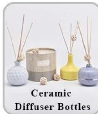
Ceramic Diffuser Bottles