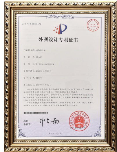
Patente nº: 201630655323.4