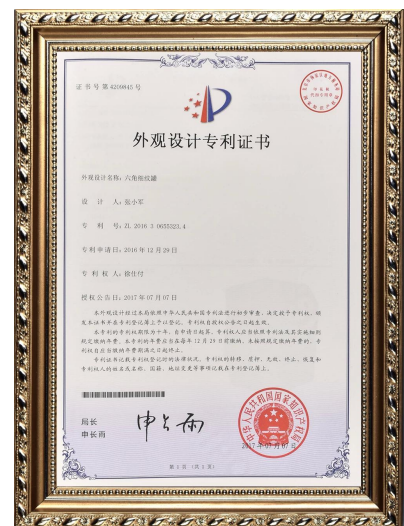
Patente nº: 201630655323.4