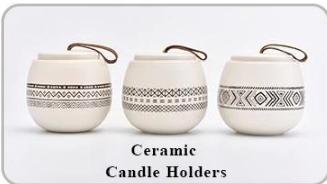
Ceramic Candle Holders