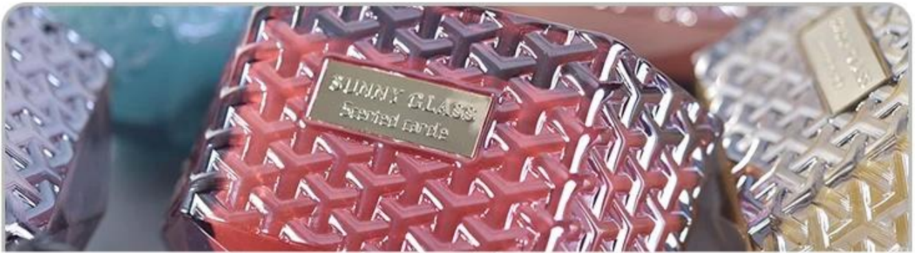
Glass Candle Holders