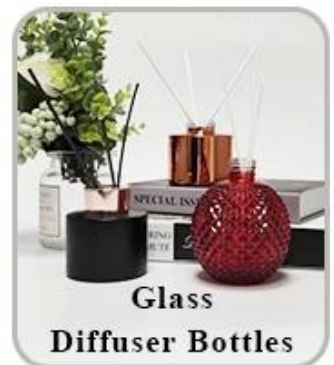
Glass Diffuser Bottles