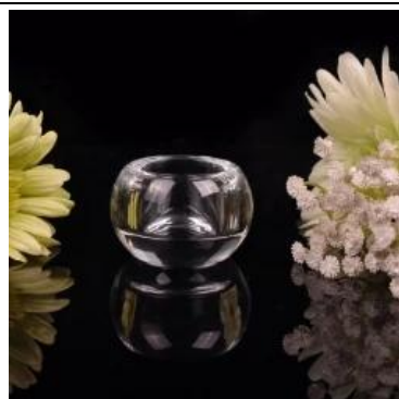
pequena tealight rodada suporte