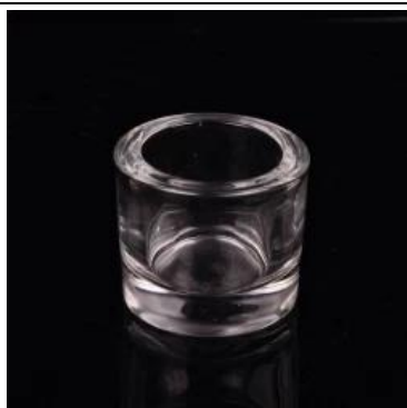
vela tealight cilindro suporte