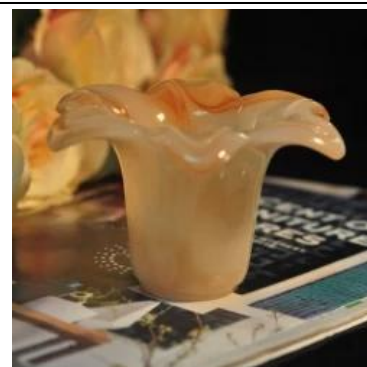
forma de flor cilindro de jade de cor âmbar jarra de vela de vidro decorativo candelabro