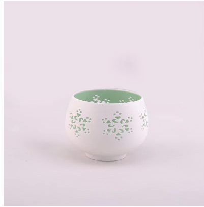
feitas à mão velas de cerâmica