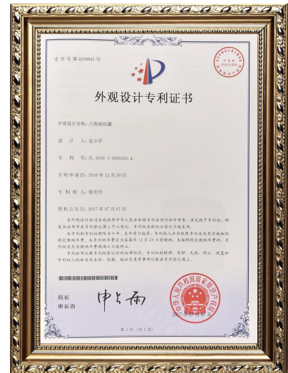
Patente Nº: 201630655323.4