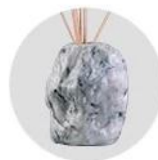
Water Transfer Printing