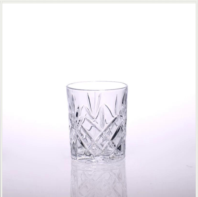
copo de vidro castiçal