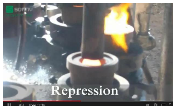
Tecnologia de prensa mecânica