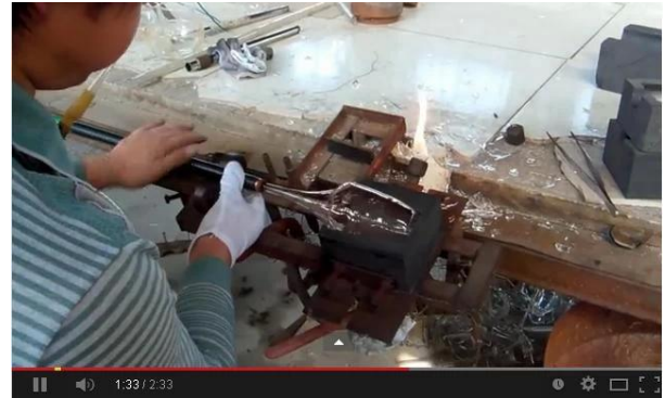
Tecnologia soprada à mão