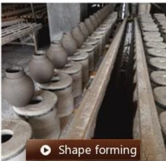
▶ Shape forming