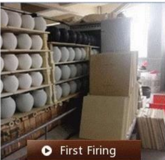
▶ First Firing