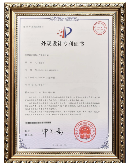
No .: +201630655323,4 patentowy