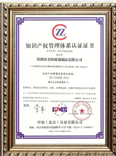
Korporacyjna własność intelektualna Nr patentowy: 201630655323.4