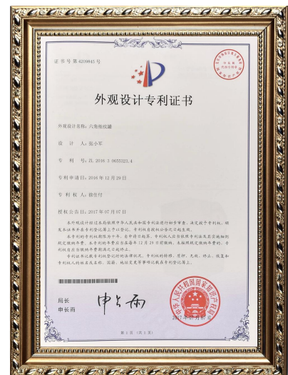
Patent Nr.: 201630655323.4