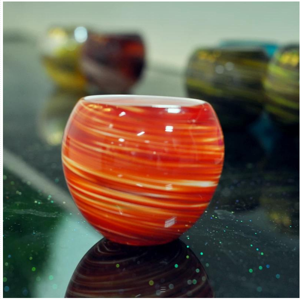
Uchwyt szkła świeca nowa