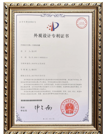
Nr patentu: 201630655323.4