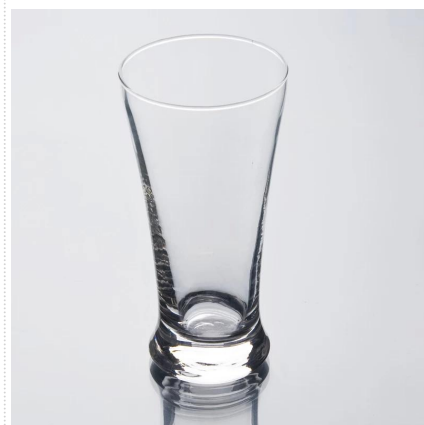
Maszyna dmuchane suszarka