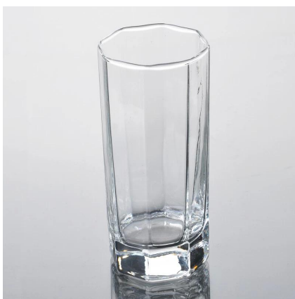
11,3 uncji Maszyna szklany puchar