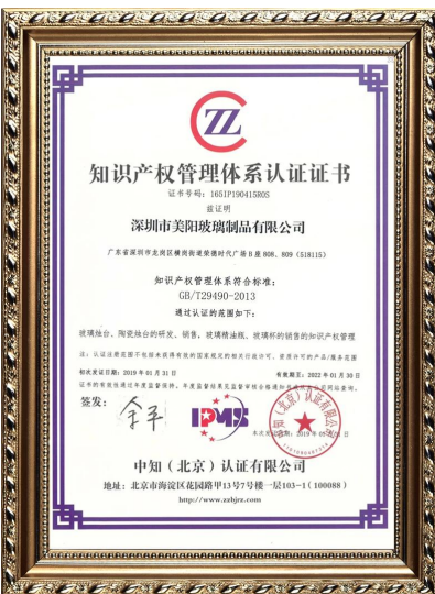
Własność intelektualna korporacji Patent nr: 201630655323.4