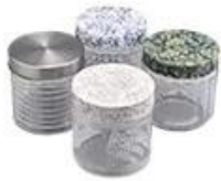
Metal with printing