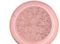
Zinc alloy embossed