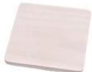
White pine wood lid