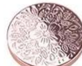
Zinc alloy embossed