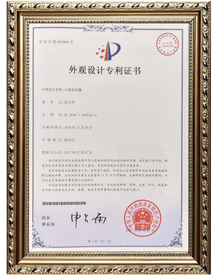
Nr patentu: 201630655323.4