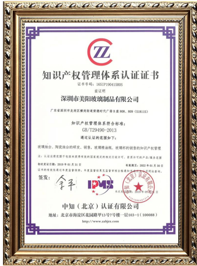
Własność intelektualna przedsiębiorstwa