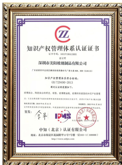
Własność intelektualna przedsiębiorstwa