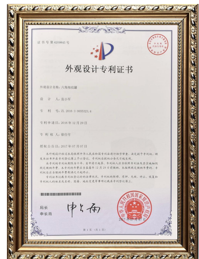
Numer patentowy: 201630655323.4