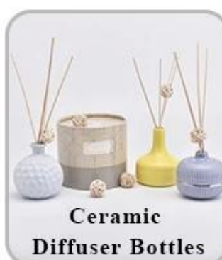
Ceramic Diffuser Bottles