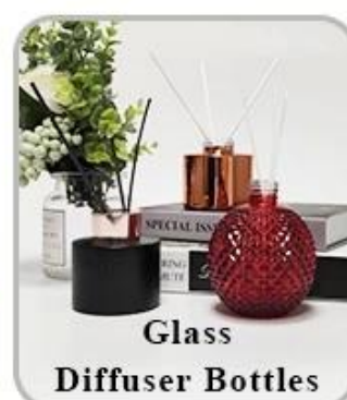
Glass Diffuser Bottles