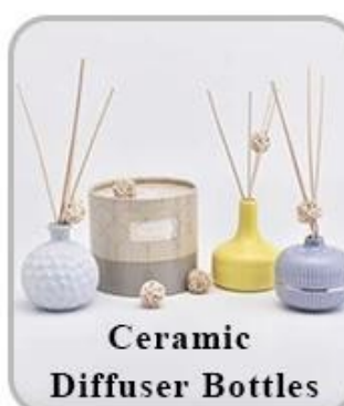
Ceramic Diffuser Bottles