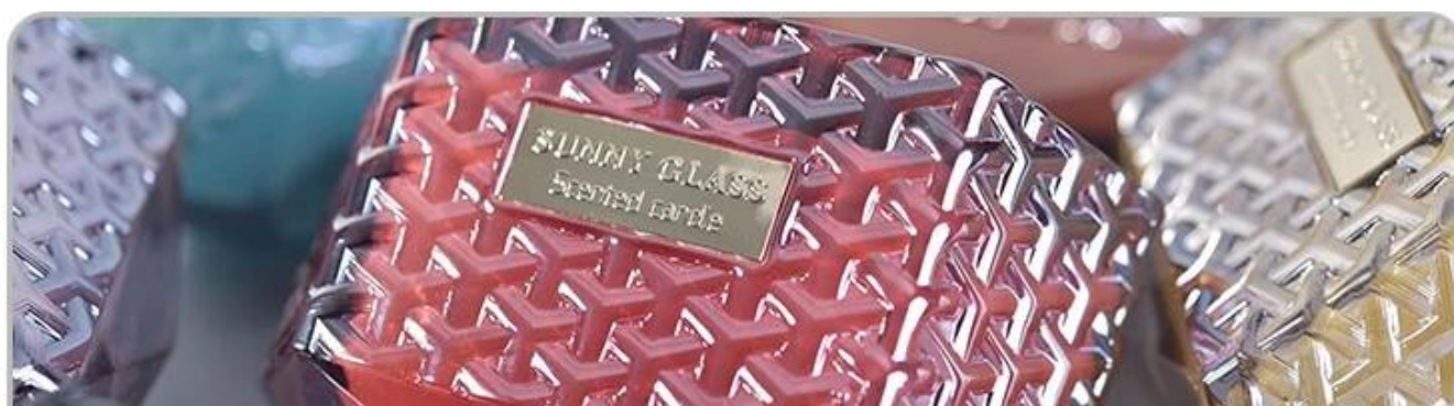
Glass Candle Holders