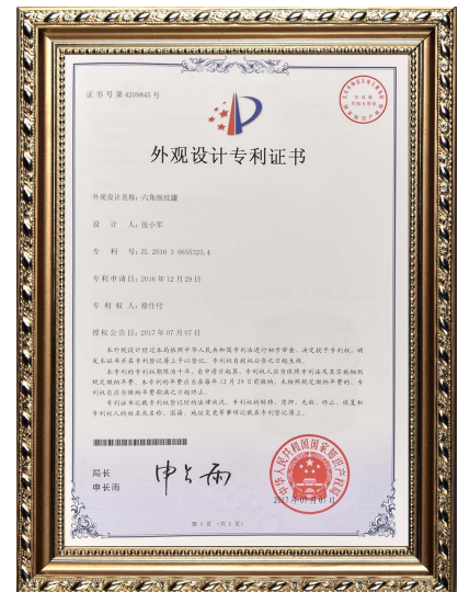
Nr patentu: 201630655323.4