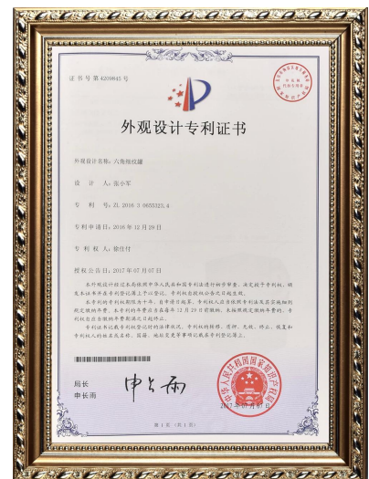
Numer patentu: 201630655323.4