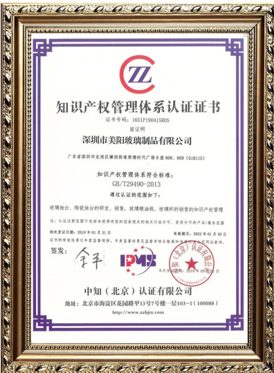
Korporacyjna własność intelektualna Patent nr: 201630655323.4