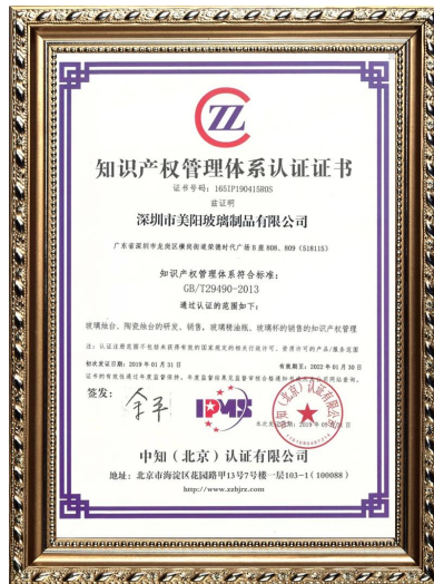
Własność intelektualna korporacji