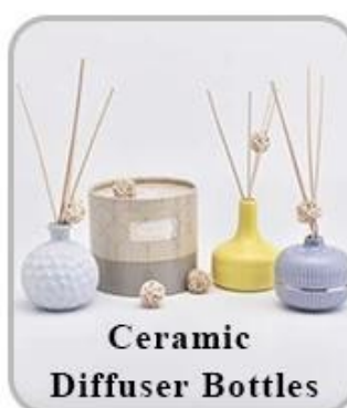
Ceramic Diffuser Bottles