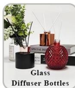
Glass Diffuser Bottles