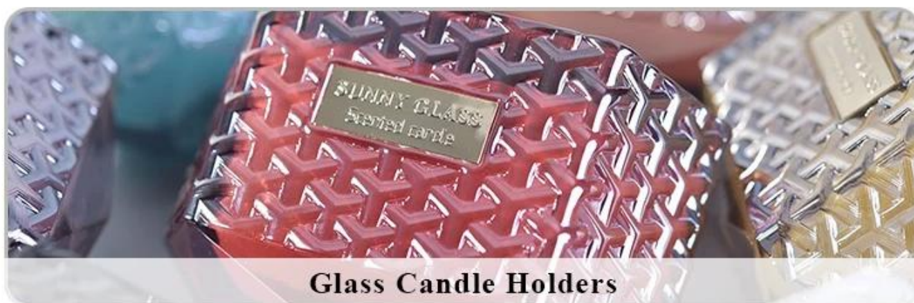
Glass Candle Holders