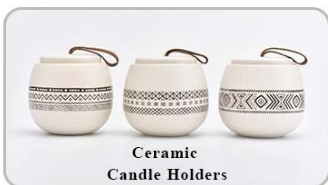
Ceramic Candle Holders