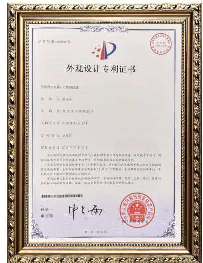
Nr patentowy: 20163065532.4