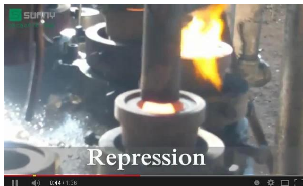
Technologia prasy mechanicznej