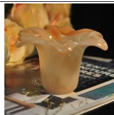
Kwiat kształt cylindra jadeit bursztynowy kolor szkła dekoracyjnego świeca jar świecznik