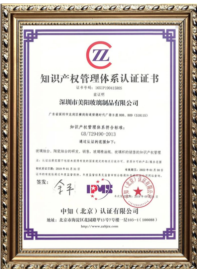
Własność intelektualna korporacji Nr patentu: 201630655323.4