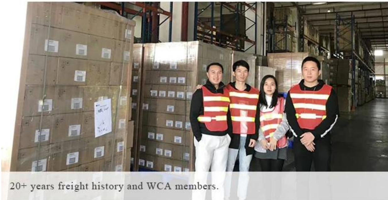
20+ years freight history and WCA members.