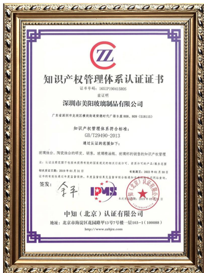
Własność intelektualna przedsiębiorstwa