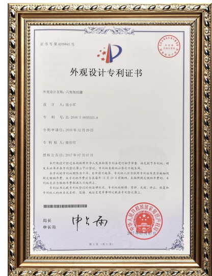
Nr patentu: 201630655323.4