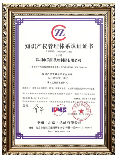
Własność intelektualna przedsiębiorstwa