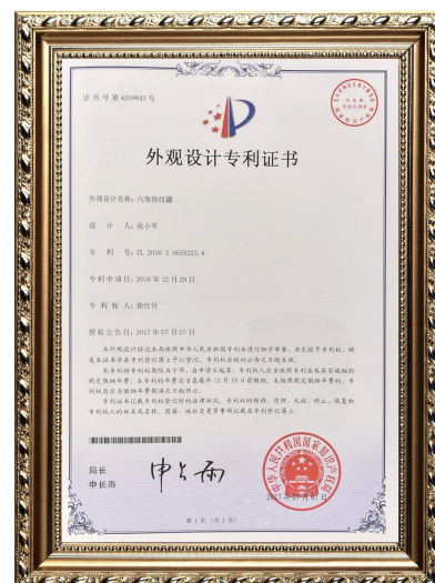
Numer patentowy: 201630655323.4