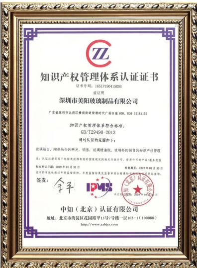
Korporacyjna własność intelektualna Nr patentowy: 201630655323.4