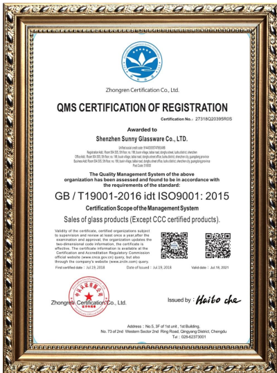
ISO 9001: 2015